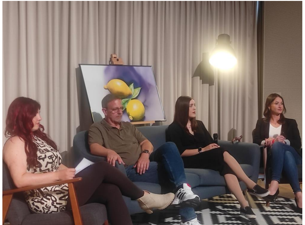
Bildbeschreibung: Das Foto zeigt die Teilnehmenden des Deep-Talks sitzend in einer Gesprächsrunde. Das Markenzeichen des Deep-Talks ist immer ein blaues Sofa.

Insgesamt knapp zweitausend Menschen waren gekommen, um die gut 80 Stände zu besuchen, sich Vorträge anzuhören oder mit Gleichgesinnten ins Gespräch zu kommen.