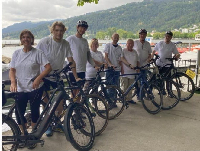
Bildbeschreibung: Foto der Teilnehmenden mit ihren Fahrrädern.

Die Bodenseerundfahrt startete in Bregenz in Österreich und führte dann über die Schweiz und Deutschland wieder zurück nach Bregenz.