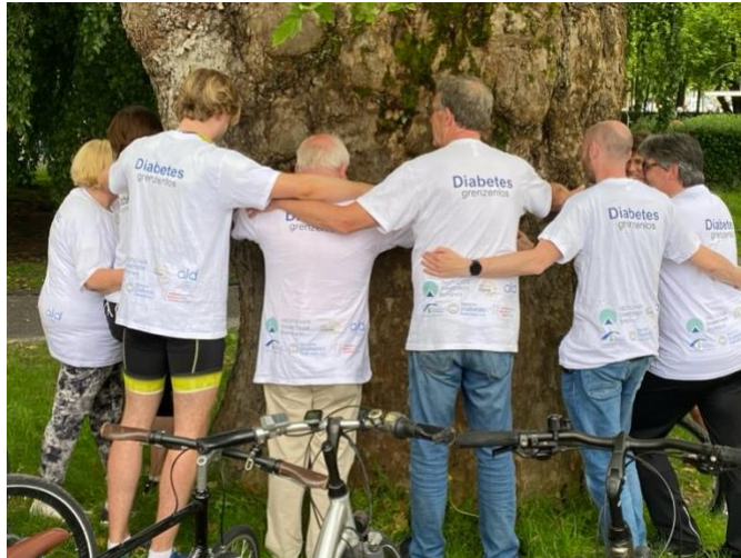
Bildbeschreibung: Die Teilnehmenden stehen in Rückenansicht umarmt um einen Baum herum. Alle tragen das weiße T-Shirt der Tour mit dem Logo „Diabetes grenzenlos“

Alle Beteiligten waren sich einig, dieses Event im nächsten Jahr zu wiederholen. Verbände aus Italien und der Niederlande sollen motiviert werden sich einer gemeinsamen Veranstaltung anzuschließen.