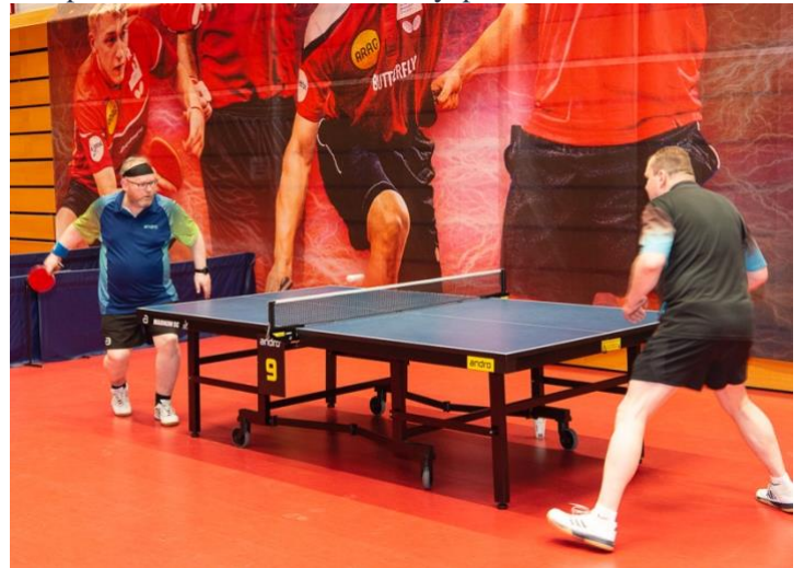
Bildbeschreibung: Hier sind zwei Tischtennisspieler in Aktion an der Tischtennisplatte zu sehen